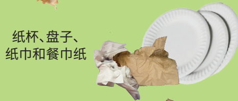
纸杯、盘子、纸巾和餐巾纸