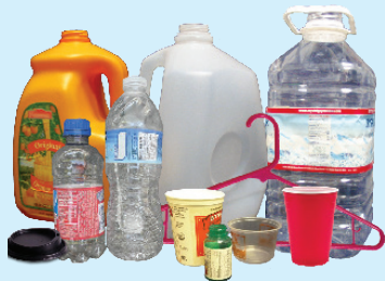
塑料容器和其他硬质塑料物品