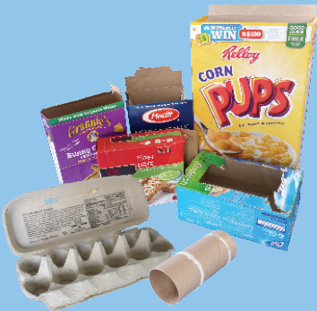
纸盒、鸡蛋盒和纸管