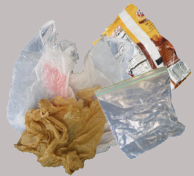
塑料袋, 薄膜和包装