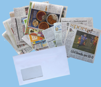
报纸、垃圾邮件和杂志