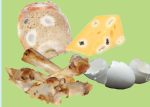
变质食物、奶制品、蛋壳和肉屑