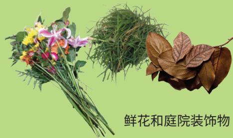
鲜花和庭院装饰物