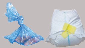
宠物垃圾、尿布和女性用品