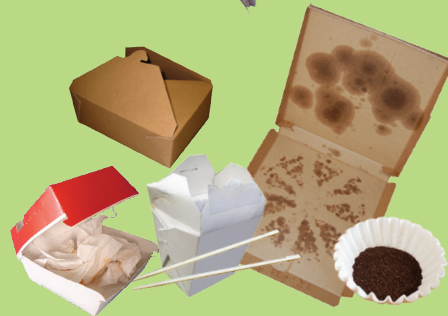
外卖纸盒和其他受食品污染的纸张